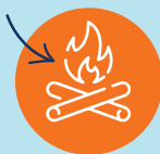
FAIRE UN FEU DE CAMP