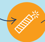
ALLUMER UN PÉTARD