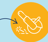
UTILISER DES MACHINES ÉLECTRIQUES